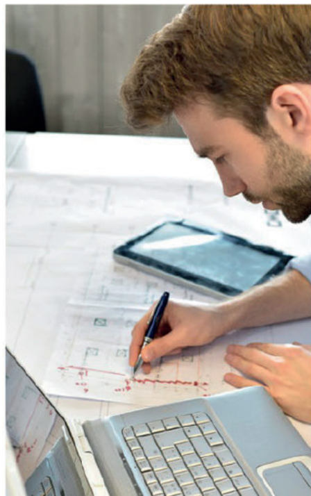
Analisi del progetto